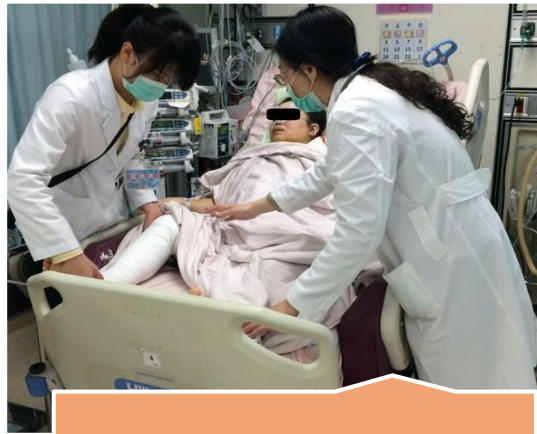
加護病房急性照護