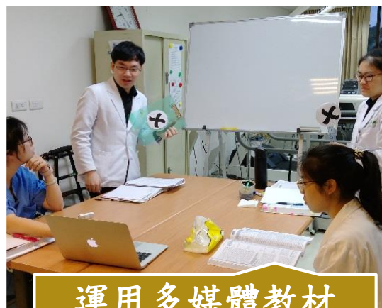
運用多媒體教材 翻轉教學