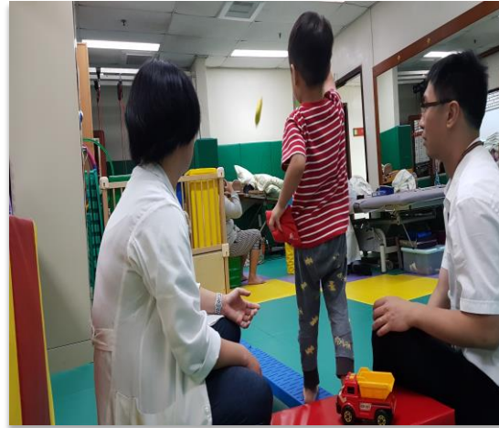
臨床實作與衛教示範