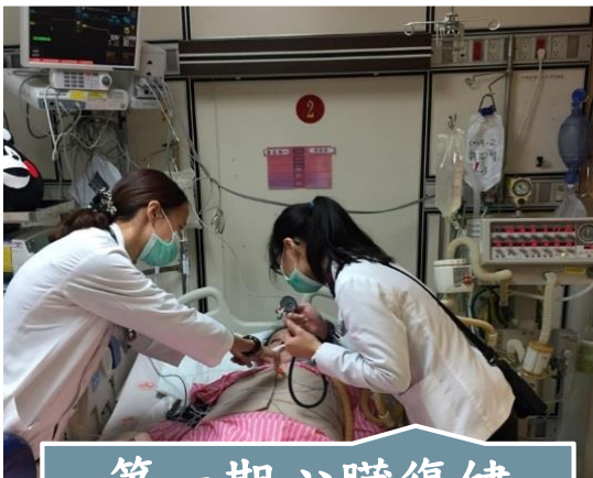
第一期心臟復健 評估與治療